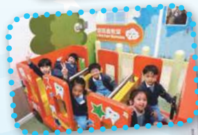
K2 參觀 陽光笑容小樂園