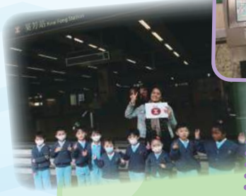
新都會商場 都市農莊