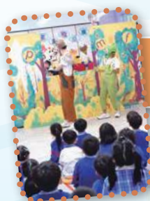
「小動物 BO PO MO FO」 巡迴劇場